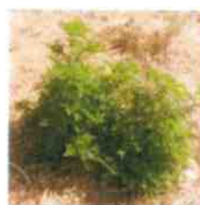
Stade végétatif Mai-Juillet