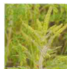
En fleur Août-Septembre